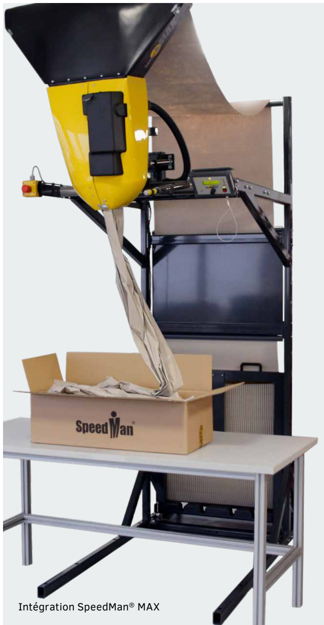
Intégration SpeedMan® MAX