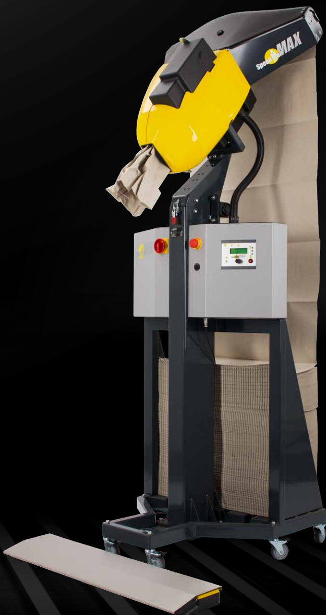
SpeedMan® MAX avec support pour pile de papier ComPackt®

contact@sem-emballage.fr www.sem-emballage.fr